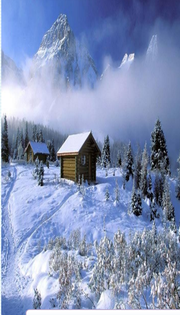
واحد آموزش مرکز چشم پزشکی علوی تبریز

شوید نباید چیزی بخورید . اما اگر فردای روز بستری ، عمل خواهید شد می‌توانید غذا میل کنید. - در بخش جراحی، موقع بستری از بیماران بالای ۴۰ سال نوار قلبی گرفته می‌شود. - اگر داروی خاصی مصرف می‌کنید حتماً دارو های خود را همراه داشته باشید. - اگر داروهای آسپرین یا وارفارین مصرف می کنید به پزشک خود یا متخصص بیهوشی اطلاع دهید. - اگر داروهای ضد فشارخون، قلبی و ضد تشنج استفاده می‌کنید، روز عمل هم با مقدار کمی آب، آن را مصرف کنید . درمورد مصرف داروهای کنترل قند خون در روز عمل با پزشک مشورت کنید.